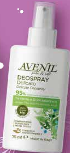
DEODORANTE DELICATO TE' VERDE AVENIL vapo, 75 ml