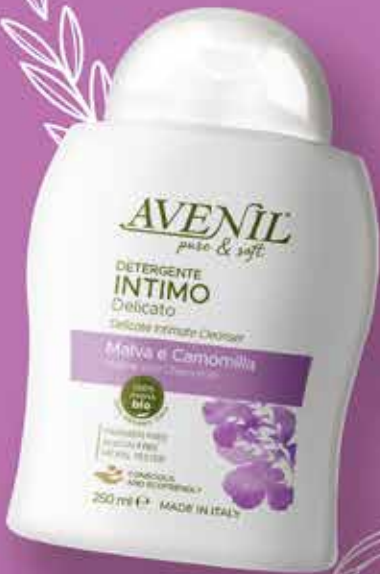
DETERGENTE INTIMO AVENIL delicato, 250 ml