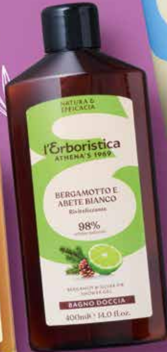
BAGNO DOCCIA L'ERBORISTICA vari tipi, 400 ml