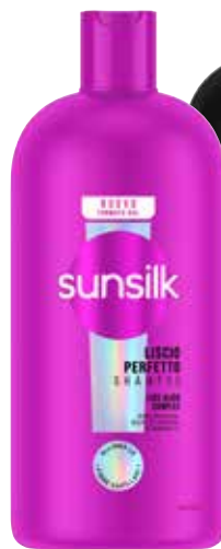
SHAMPOO SUNSIK vari tipi, 810 ml