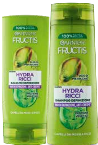
SHAMPOO, BALSAMO FRUCTIS GARNIER vari tipi, shampoo 250 ml, balsamo 200 ml