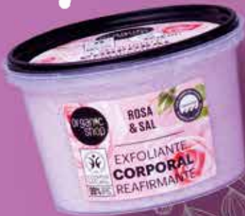
SCRUB CORPO ORGANIC SHOP vari tipi, 250 ml