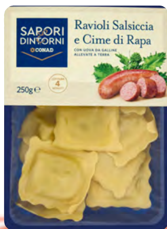
Ravioli Salsiccia e Cime di Rapa Saponi&Dintorni Conad 250 g