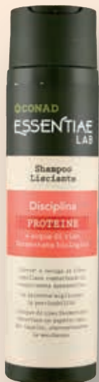
SHAMPOO LISCIANTE PROTEINE CONAD ESSENTIAE LAB disciplina 250 ml