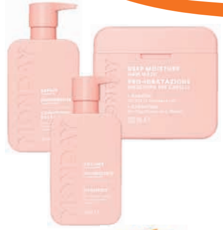
LINEA CAPELLI MONDAY shampoo, balsamo, maschera vari tipi e grammature