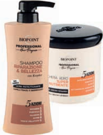
LINEA CAPELLI PROFESSIONAL HAIR PROGRAM BIOPOINT prodotti assortiti