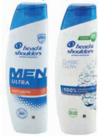
SHAMPOO ANTIFORFORA HEAD & SHOULDERS vari tipi 250 ml