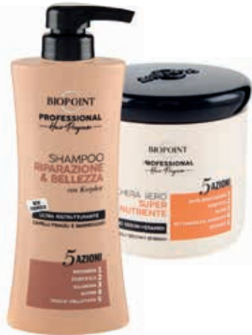
LINEA CAPELLI PROFESSIONAL HAIR PROGRAM BIOPOINT prodotti assortiti