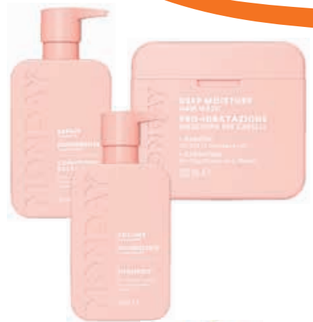
LINEA CAPELLI MONDAY shampoo, balsamo, maschera vari tipi e grammature