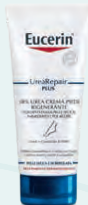
CREMA PIEDI UREA REPAIR PLUS EUCERIN Sollievo immediato e 48 ore di libertà dai sintomi della pelle secca, molto secca e tesa di piedi e talloni. Leviga i talloni con calli ed ispessimenti, 100 ml