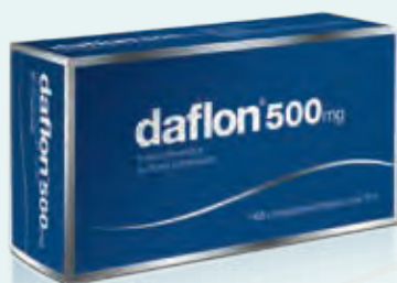
DAFLON 60 compresse rivestite 500 mg