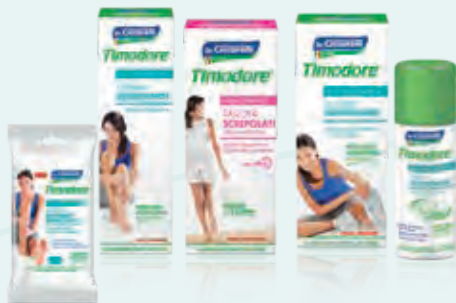
LINEA TIMODORE soluzione ideale per combattere il fastidioso problema dell'eccessiva sudorazione e cattivo odore del piede