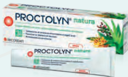
PROCTOLYN NATURA Crema rettale con aloe, acido ialuronico estratti e oli naturali con 3 azioni per il trattamento di sindrome emorroidaria e ragadi anali, 30 ml