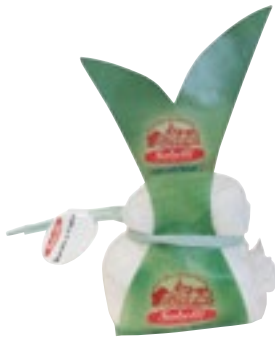
BURRATA IN FOGLIA SABELLI