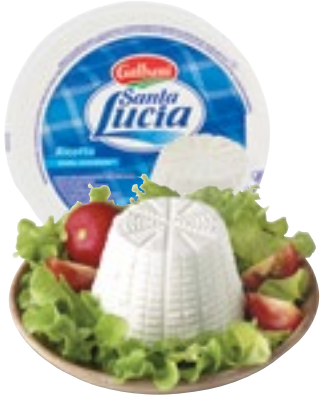
RICOTTA SANTA LUCIA GALBANI