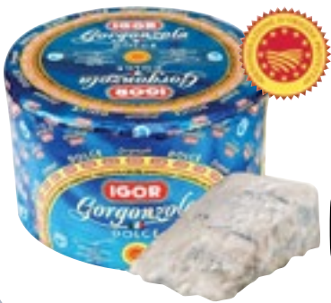
GORGONZOLA DOP IGOR