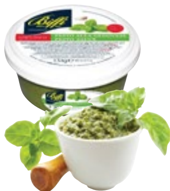
PESTO FRESCO GENOVESE BIFFI