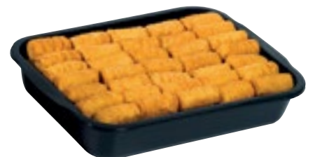
CROCCHETTE DI PATATE CUCINA NOSTRANA