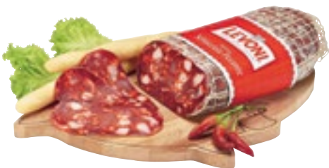
SCHIACCIATA PICCANTE LEVONI