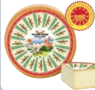
PUOZZONE DI MOENA DOP