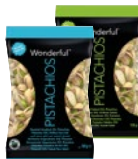
PISTACCHI TOSTATI WONDERFUL salati - non salati 125 g