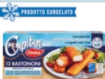
12 BASTONCINI FINDUS 300 g