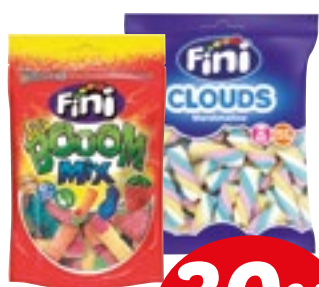
LINEA CAMELLE FINI