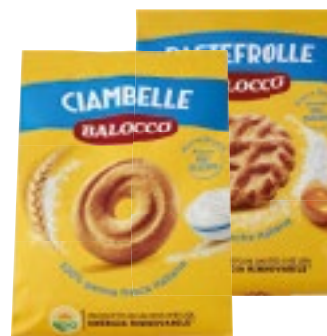
BISCOTTI BALOCCO assortiti 700 g