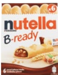
B-READY NUTELLA FERRERO pz. 6 132 g