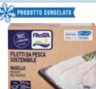
FILETTINI NASELLO FROSTA 300 g