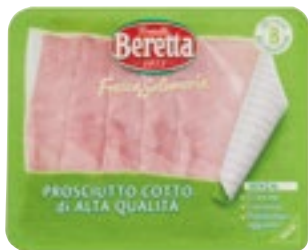
AFFETTATI BERETTA PROSCIUTTO COTTO ALTA QUALITÀ 120 g