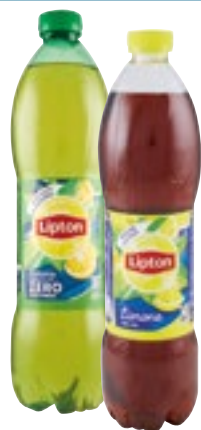
ICE TEA LIPTON verde - limone - pesca 1,5 L