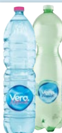
ACQUA VERA frizzante - naturale 1,5 L