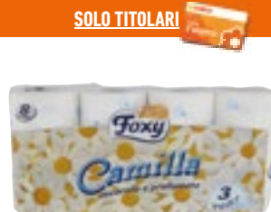
CARTA IGIENICA PROFUMATA FOXY 3 veli - 8 rotoli