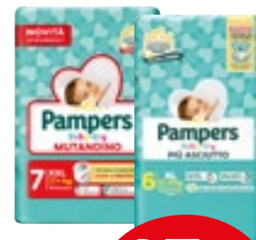
LINEA PANNOLINI PAMPERS