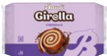
GIRELLA BAULI classica 280 g