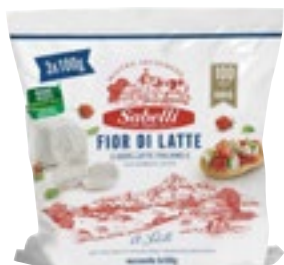
MOZZARELLA FIOR DI LATTE SABELLI 100 g x3 300 g