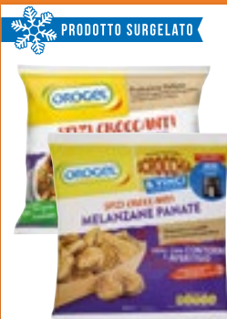
PRODOTTI SURGELATO SFIZI CROCCANTI OROGEL tris panato - melanzane panate - verdure in tempura da 350 g a 400 g