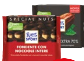
LINEA TAVOLETTE DI CIOCCOLATO RITTER SPORT