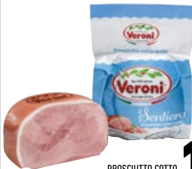
PROSCIUTTO COTTO IL SENTIERO VERONI