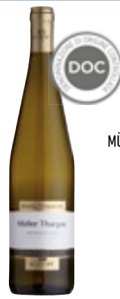
MÜLLER THURGAU DOC CAVIT 750 ml