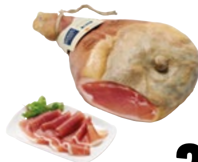
PROSCIUTTO DI PARMA SAPORI&DINTORNI CONAD 20 mesi