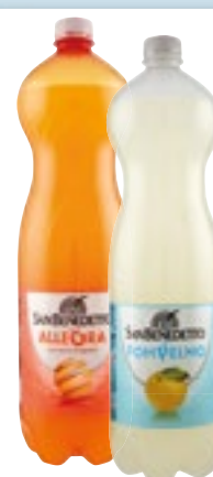
BIBITA SAN BENEDETTO gusti assortiti 1,5 L