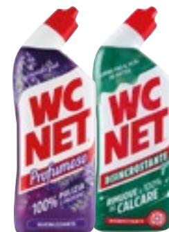
DETERGENTE GEL WC NET assortiti 700 ml