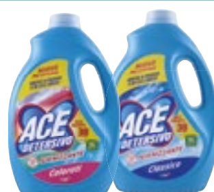
DETERSIVO LAVATRICE LIQUIDO IGIENIZZANTE ACE classico - colorati 1,9 L