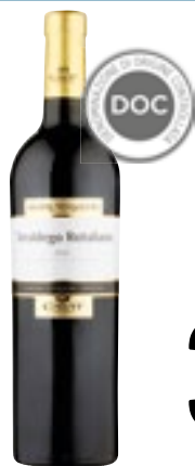
TEROLDEGO ROTALIANO DOC CAVIT 750 ml