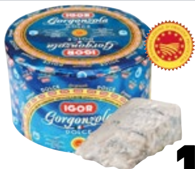
GORGONZOLA DOP IGOR