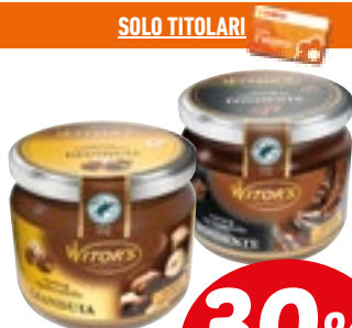
LINEA CREMA SPALMABILE WITOR'S