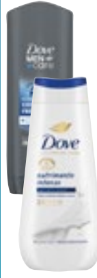
DOCCIASCHUMA DOVE assortiti da 225 ml a 250 ml