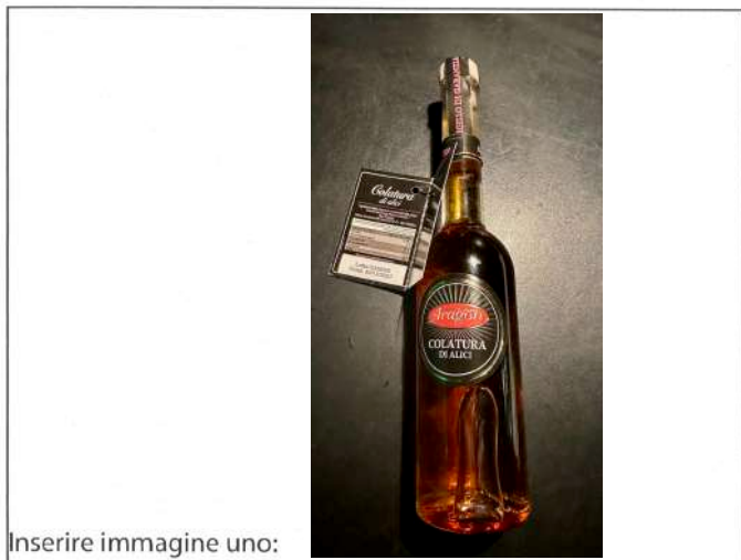
Inserire immagine uno: